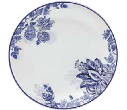
Tatlı tabağı, 109 TL, Fern&Co; ferncplates.com

“Bon Objet evi, modern dünyaya uyumlu, fonksiyonel ve tasarımın gücüyle beslenen mobilyalarla fark yaratan yaşam alanları demek.”