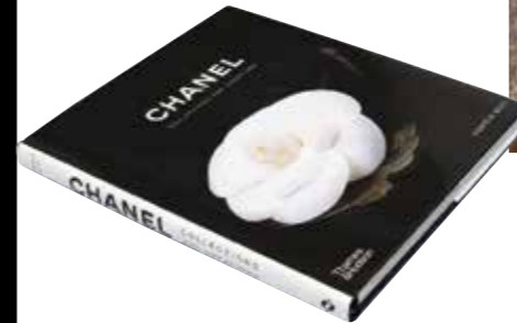
Ciltli kitap, 470 TL, Chanel, Beria Home; beria.com