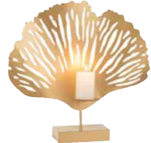
Mercan mumluk, 625 TL, Room Diaries; roomdiaries.com