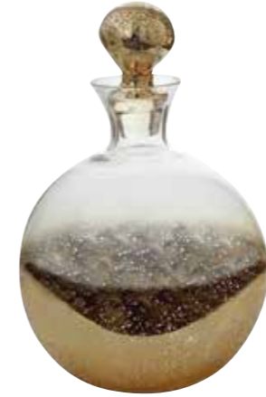
Elmas karaf, 151,25 TL, Porland; (0212) 380 09 46.