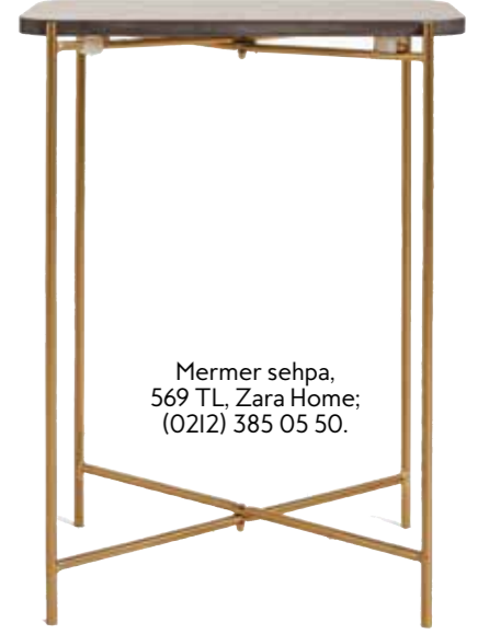
Mermer sehpa, 569 TL, Zara Home; (0212) 385 05 50.