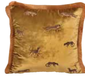
Kadife nakışlı kırkent, 300 TL, Ge Living; geliving.com