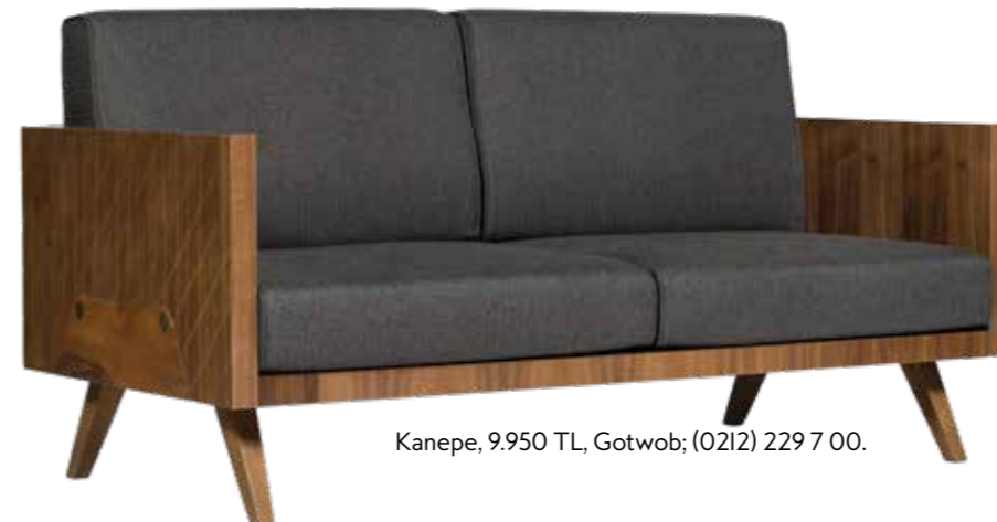
Kanep, 9.950 TL, Gotwob; (0212) 229 7 00.

Keten peçete seti, (dörtlü) 999 TL, Serenk, Beymen Home; (0212) 316 69 00.